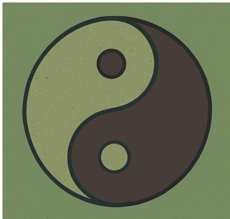
Простота и сложность взаимодействуют как инь и ян

Простота и сложность взаимодействуют как инь и ян: дополняют друг друга, перетекают друг в друга и существуют внутри друг друга.